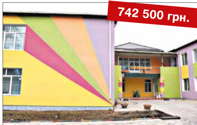
Впровадження енергозберігаючих технологій в ДНЗ №1 «Журавлик» смт Дашів