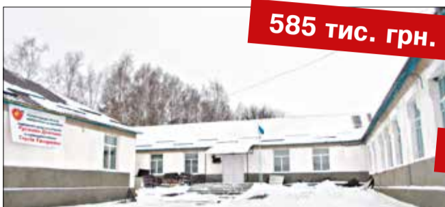
Капітальний ремонт та утеплення даху Кантелинської ЗОШ I-III ступенів