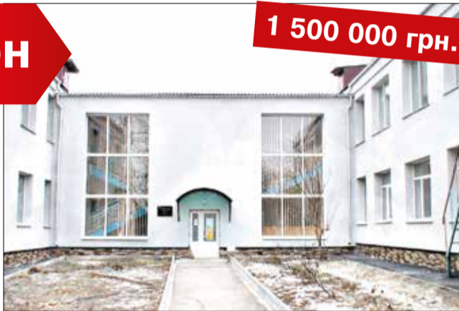
Капітальний ремонт будівлі липовецького ДНЗ №1 «Сонечко» (утеплення стін, даху, заміна віконних конструкцій)