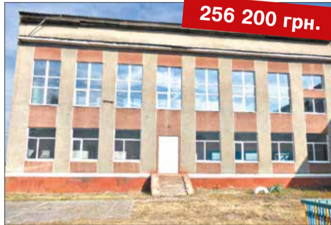
Капітальний ремонт із заміною віконних та дверних блоків у Вахнівській ЗОШ I-III ст.