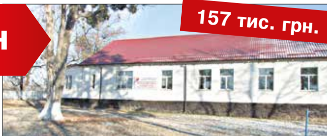
Капітальний ремонт даху навчального корпусу №2 Дашівської ЗОШ I-III ступенів