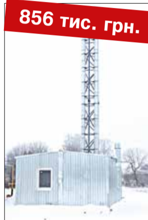
Встановлення модульної котельні на твердому паливі в Іллінецькій ЗОШ I-III ст.