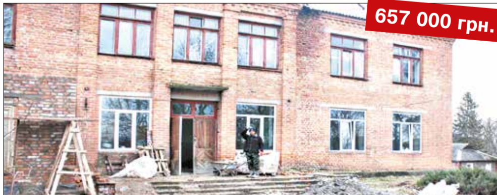
Реконструкція приміщення школи під ДНЗ с. Рожична