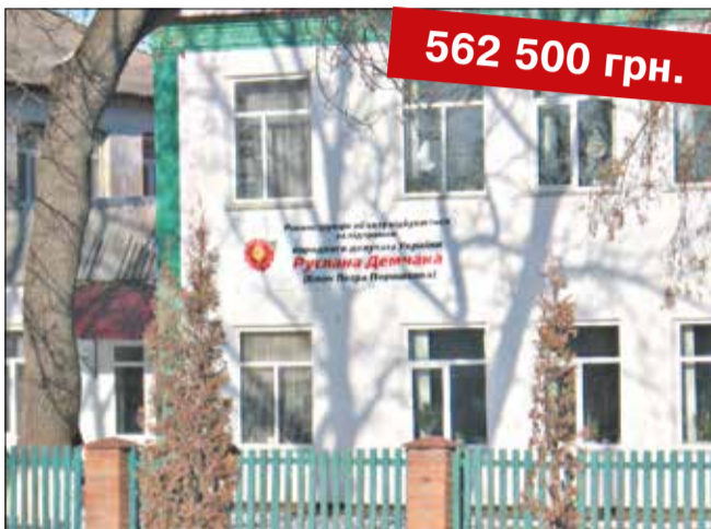
Утеплення даху Іллінецької ЗОШ I-III ступенів №1