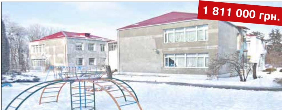
Капітальний ремонт ДНЗ «Сонечко» смт Оратів