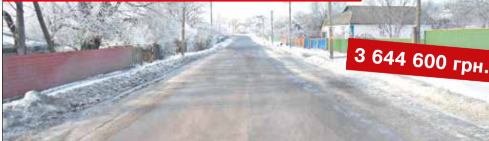
Капітальний ремонт дороги державного значення Р-17 «Біла Церква – Тетіїв – Липовець – Гуменне» по смт Оратів