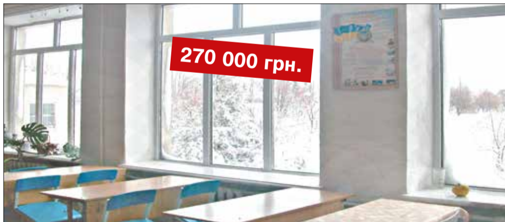
Впровадження енергозберігаючих технологій в школі с. Скоморошки