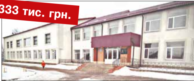
Реконструкція фасаду (утеплення стін та заміна віконних блоків) в Іллінецькому НВК, ЗОШ I-III ст. №2